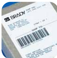
Štítky pre zasielanie