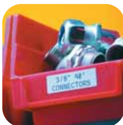
Označenie regálov a priehradok