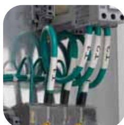
Návleky pre označovanie vodičov