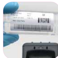
Identifikačné etikety pre laboratória a medicínu